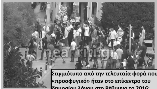
Στιγμιότυπο από την τελευταία φορά που το «προσφυγικό» ήταν στο επίκεντρο του δημοσίου λόγου στο Ρέθυμνο το 2016: ντόπια αφεντικά και σκατόψυχοι βγαίνουν στο δρόμο με την υποστήριξη των μπάτσων

Παράλληλα με το ΕΣΤΙΑ πραγματοποιούνται συζητήσεις για το ενδεχόμενο δημιουργίας δομών φιλοξενίας ανήλικων μεταναστών/ριων. Η ίδια η υφυπουργός Εργασίας και Κοινωνικών Υποθέσεων Δόμνα Μιχαηλίδου έπειτα από συζητήσεις με την τοπική αυτοδιοίκηση της Κρήτης μας ενημερώνει ότι το ποσό των χρημάτων που θα μοιράζεται για κάθε παιδί θα ανέρχεται στα 68 ευρώ ημερησίως 9 θέλοντας να επισημάνει